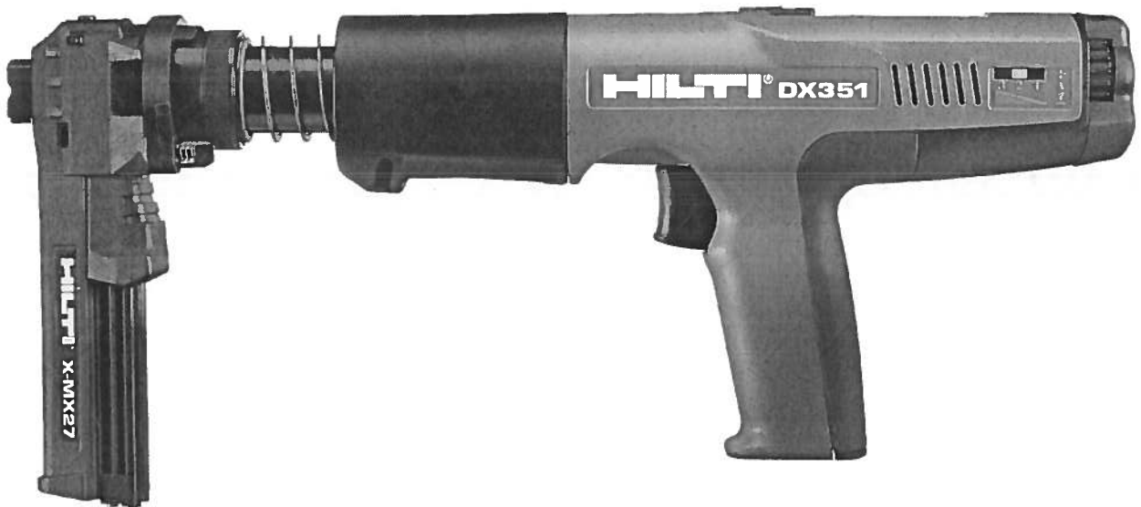
Abb.: Bolzenschubwerkzeug DX 351 für Kartuschenmunition 6,8/11 M

Das Bolzenschubwerkzeug wird mit der Laufmündung auf die Eintreibstelle angesetzt. Durch Andrücken wird das Werkzeug in Auslösestellung gebracht. Die Auslösung erfolgt über einen Querriegel, welcher nur in dieser Stellung durch Betätigung des Abzuges den Schlagbolzen (Zündstift) freigibt und die Kartusche zündet. Mit dem Abheben des Gerätes von der Eintreibstelle, wird der Streifen um einen Schritt weiter transportiert.