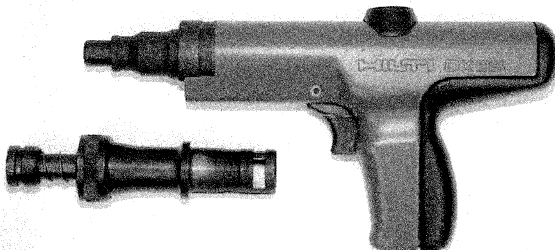
Abb.: Bolzenschubwerkzeug DX 35 6,3/10 M und Bolzenführung Tunnelausrüstung

Das Bolzenschubwerkzeug wird mit der Laufmündung auf die Eintriebsstelle angesetzt. Durch Andrücken wird das Werkzeug in Auslösestellung gebracht. Die Auslösung erfolgt über einen Querriegel, welcher nur in dieser Stellung durch Betätigung des Abzuges den Schlagbolzen (Zündstift) freigibt und die Kartusche zündet. Durch das Herausziehen der Bolzenführung und das Zurückstoßen bis zum dazugehörigen Anschlag (Repetiervorgang), wird die nächste Kartusche vor das Kartuschenlager transportiert.