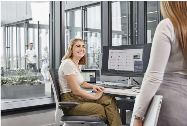
Bild 5: Auszubildende in kaufmännischen Ausbildungen wie Kaufleute für IT-System-Management oder Kaufleute für Dialogmarketing